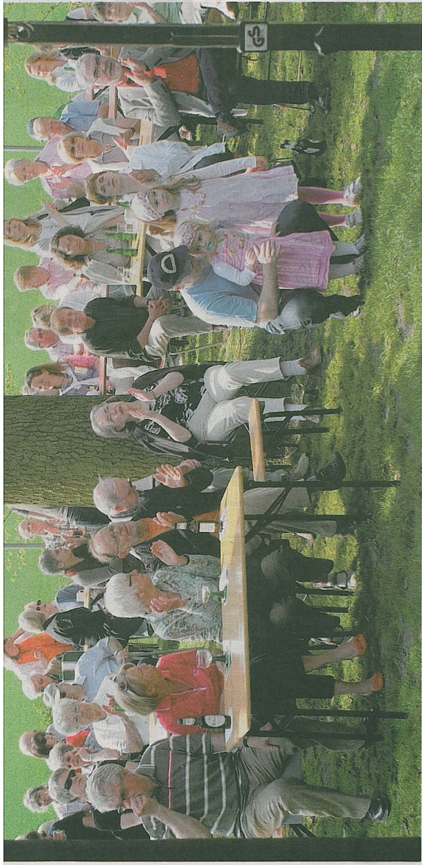
Spaß für Groß und Klein: Bei schönem Wetter lässt es sich unter den knorrigen Eichen gut aushalten. Jahr für Jahr lockt der Farmhouse Jazzclub mehr als 8.000 Besucher mit guter, handgemachter Musik.