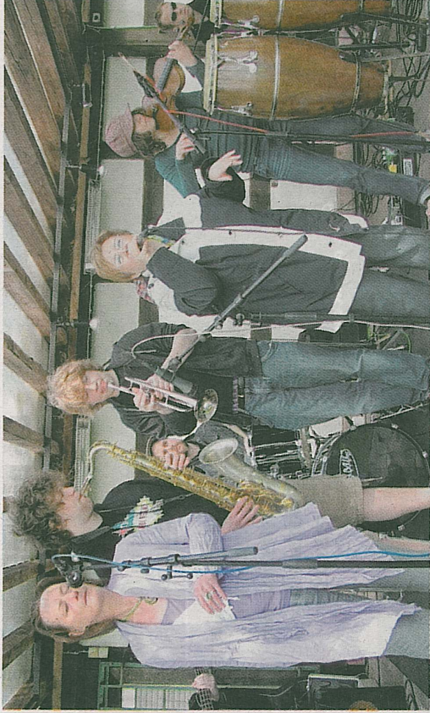
Flotte Rhythmen: Die bekannte Gütersloher Band „Soul 4 Session“ gab erst vor wenigen Tagen im Farmhouse Jazzclub ein Gastspiel.